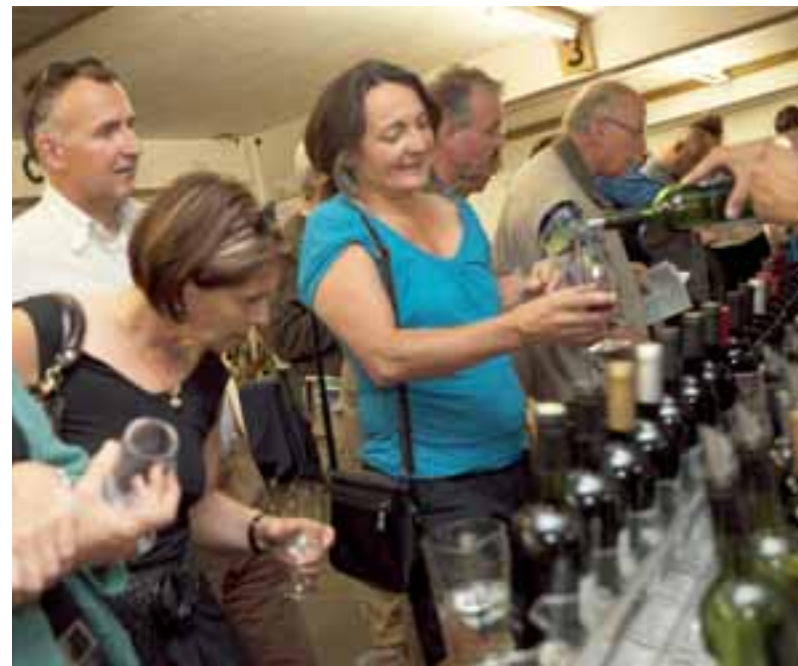
Am Degustationsfest kann das gesamte Sortiment des Küferwegs verkostet werden. Rund 150 Weine stehen zur Auswahl bereit.

12 bis 16 Uhr: Kleinigkeiten in Uschi Schneebelis Pilzbeizli