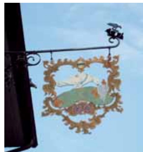
Lieber eine Taube als ein Spatz im Wirtshausschild.

Taberna la Paloma Weinstube zur Taube Untere Altstadt 26 6300 Zug 041 711 32 66 Sonntag und Montag geschlossen