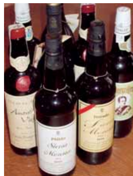
Nicht nur zum Aperero, auch als Essensbegleiter ein Vergnügen: die Sherry-ähnlichen Weine Sierra Morena aus dem Küferweg-Sortiment.