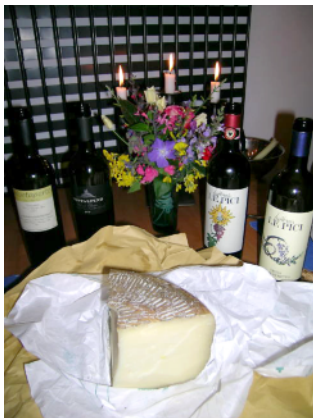
Ursprünglichkeit und Einfachheit auch bei kulinarischen Genüssen: Ein feiner Wein und Stück Pecorino aus Pienza machen ein Festessen

Samstag: 15.30 Uhr Fahrt mit Minibus von Florenz Hauptbahnhof Santa Maria Novella nach Castello di Montalto oder individuelle Anreise. 19.30 Uhr Willkommensapéro.