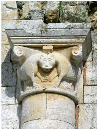
Auch die vielen Details lohnen einer Entdeckung