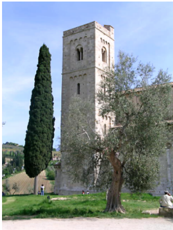
Sant' Antimo Licht, Himmel und Stein in beeindruckender Harmonie

Küferweg-Woche auf Castello di Montalto 6. - 13. Oktober 2012