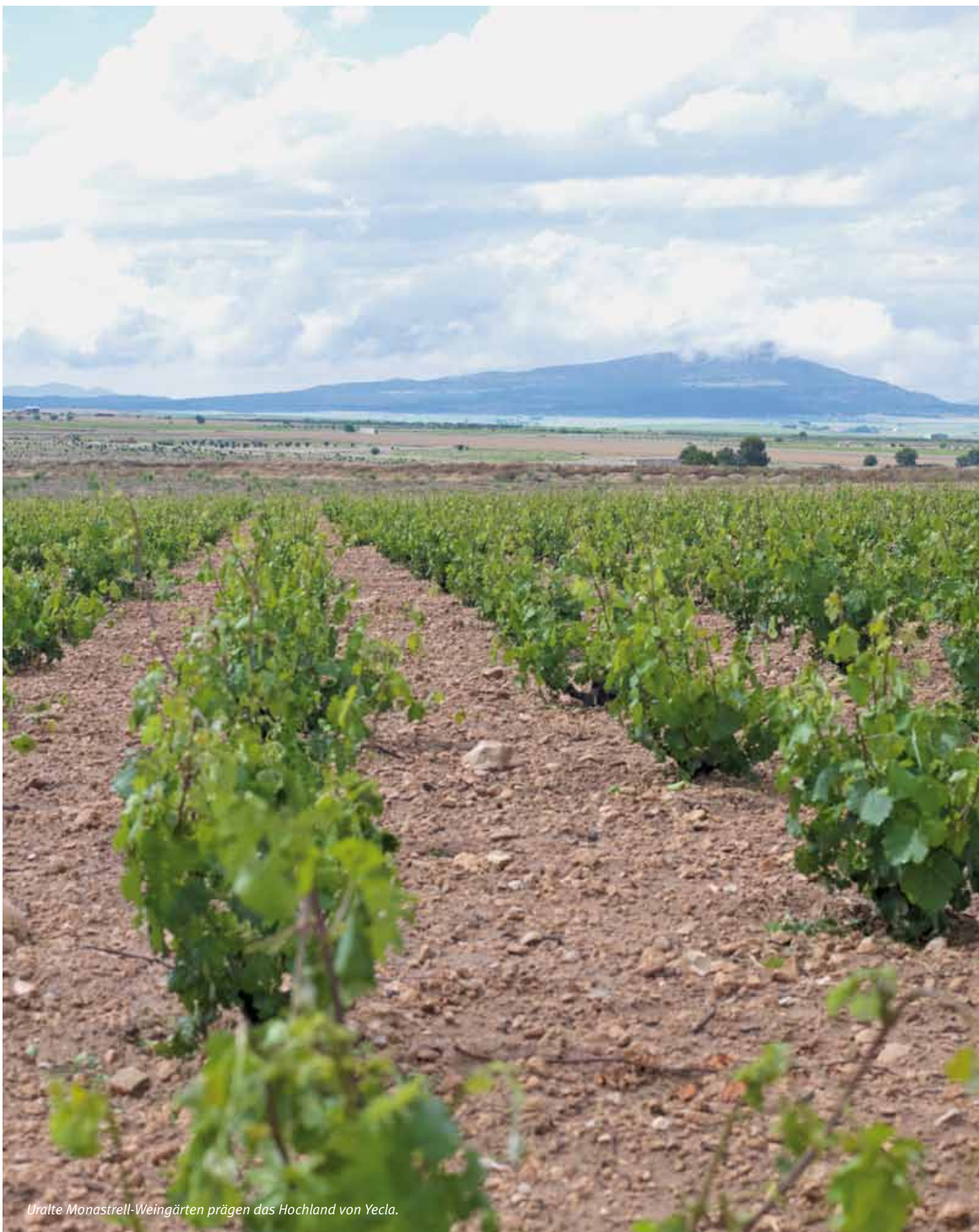
Uralte Monastrell-Weingärten prägen das Hochland von Yecla.