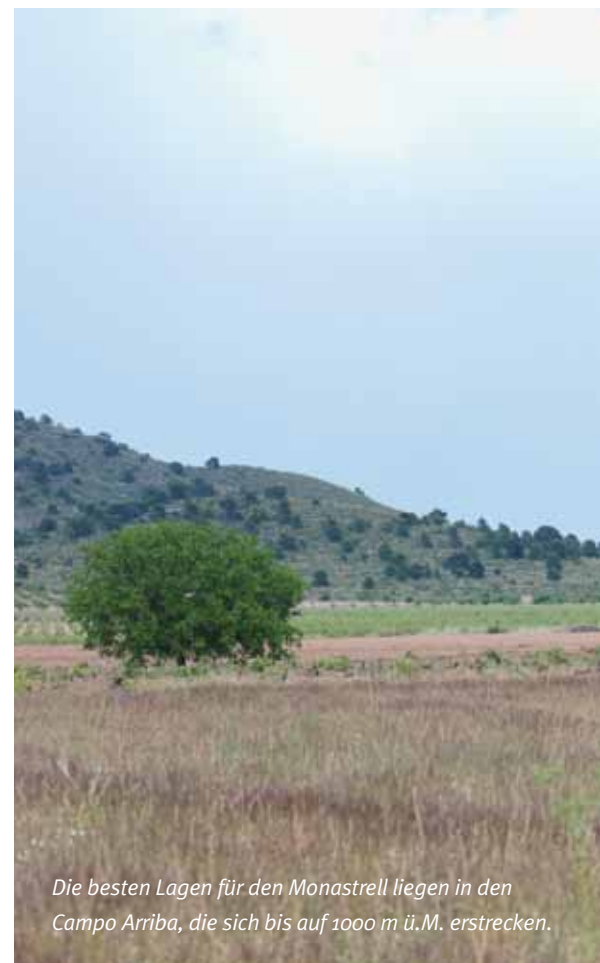
Die besten Lagen für den Monastrell liegen in den Campo Arriba, die sich bis auf 1000 m ü.M. erstrecken.

Die drei La Purísima-Weine werden in der Schweiz exklusiv durch die Weinhandlung am Küferweg geführt. Lernen Sie Valcorso, Estio und Trapio im Probierpaket zum Preis von Fr. 37.– (statt Fr. 47.60) kennen.