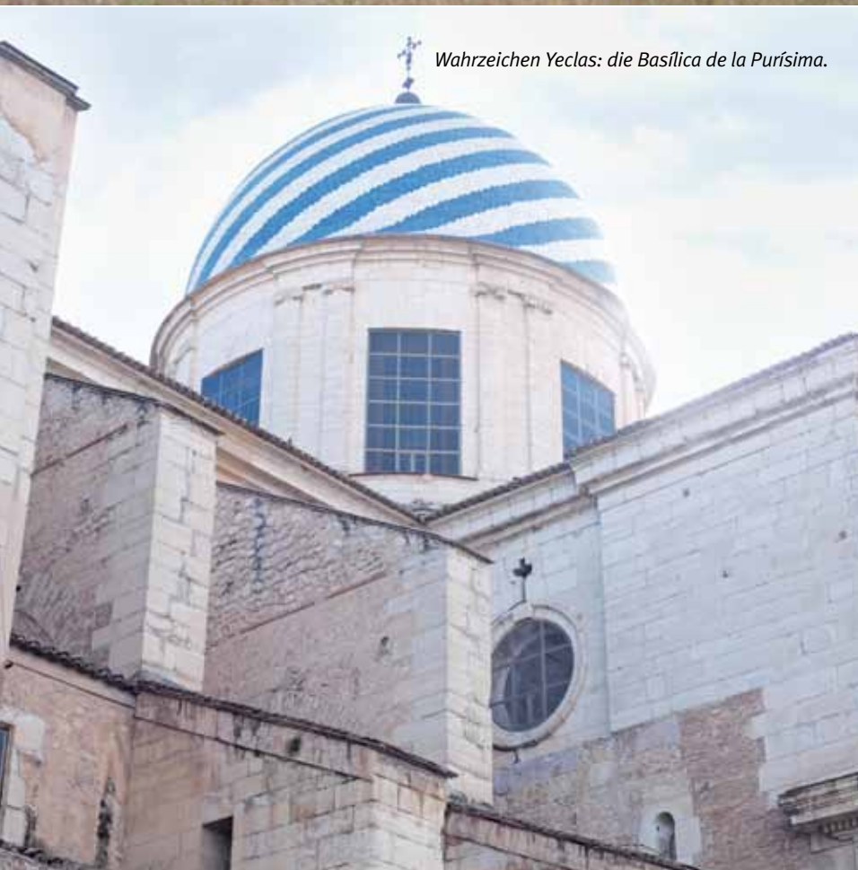
Wahrzeichen Yeclas: die Basílica de la Purísima .