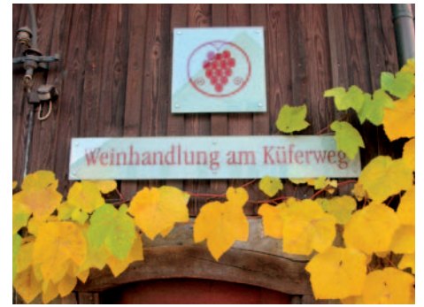
Erfreuliches Fazit der Kundenumfrage: die Weinhandlung am Küferweg ist auf Kurs.

Mit der Umfrage war auch eine Verlosung von drei Überraschungspaketen mit Spitzenweinen aus dem Sortiment verbunden (Fendant de Fully, Marie-Thérèse Chappaz, CH; Riesling Terrassen, Loimer, A; Barbaresco, Punset, I; Châteauneuf-du-