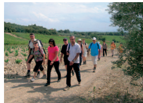
Per pedes ist die beste Art, die anmutige toskanische Landschaft zu erleben.