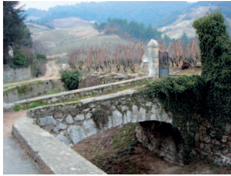
Die Domaine du Coulet liegt am Dorfrand, umgeben von Reben.