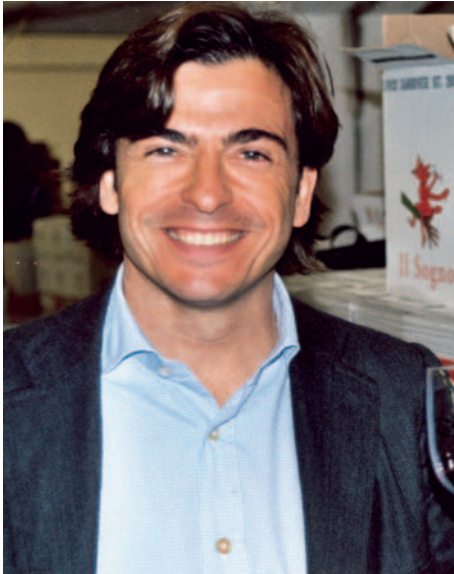
»Toro mit Telmo«: Pago la Jara im Fokus der Degustation.