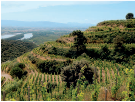
Blick über die Weinberge von Cornas, im Hintergrund die Rhône.